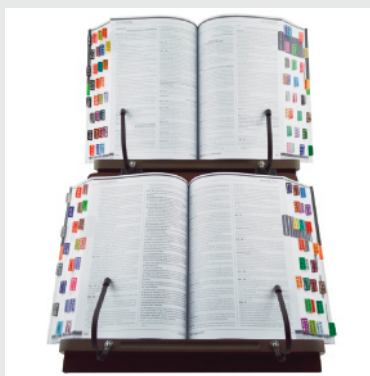
Suporte para Livros Duplo

← Acesse o QR Code ao lado, vídeo completo.