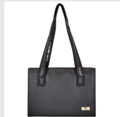
Capa para Vade Mecum com Alça de Ombro

Conheça toda a linha Marca Fácil no site www.marcafacil.com